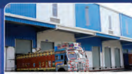
FIRST MILE LAST MILE