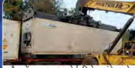
अप्रैल में बानाा एक्सपोर्ट विशेष कंटेनर ट्रेन