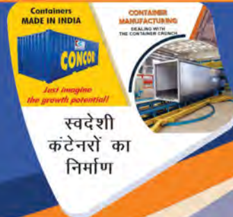
कंटेनरों का प्रयोग गोदाम के रूप में