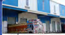
फर्स्ट माइल लार्स्ट माइल