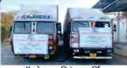
बॉन्डेड ट्रकिंग सर्विस

फोन : 011-41222500/600/700 | वेबसाइट: www.concorindia.co.in | ईमेल : investorrelations@concorindia.com