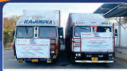
BONDED TRUCKING SERVICE

Ph.: 011-41222500/600700 | Website : www.concorindia.co.in | E-mail : investorrelations@concorindia.com