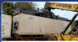
BANANA EXPORT SPECIAL CONTAINER TRAIN IN APRIL