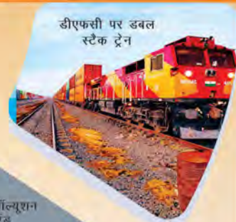
लॉजिस्टिक सॉल्यूशन एंड टू एंड