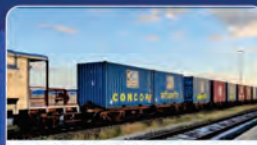
DIRECT PORT DELIVERY