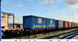
सीधे पोर्ट पर डिलीवरी